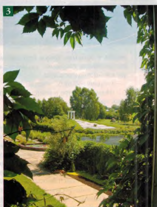
1 – «Храм воздуха и света» 2 – Дом в ангаре 3 – Вид на владения из окна 4 – Ирисы цвели повсюду