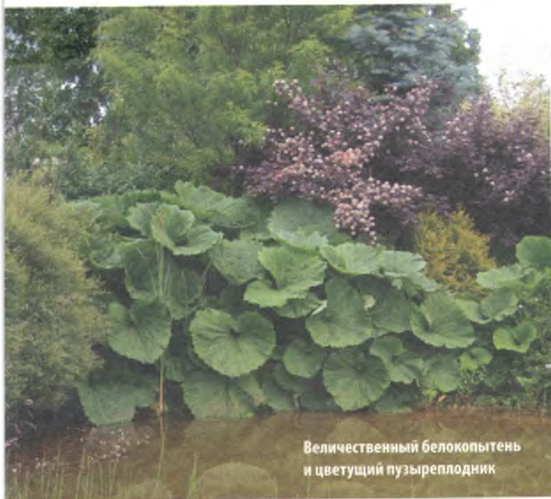
Величественный белокопытень и цветущий пузыреплодник