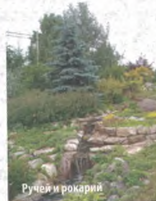
Ручей и рокарий