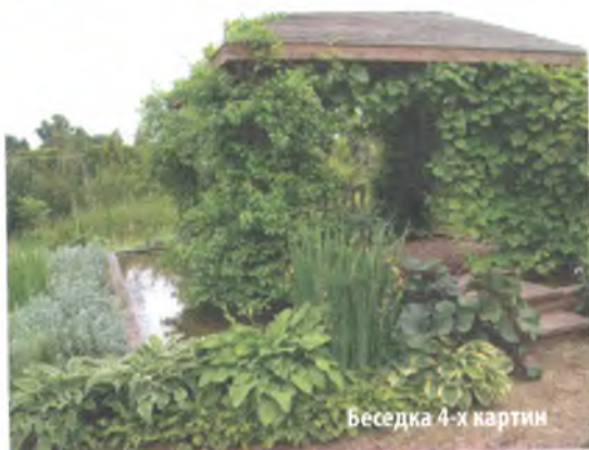
Беседка 4-х картин