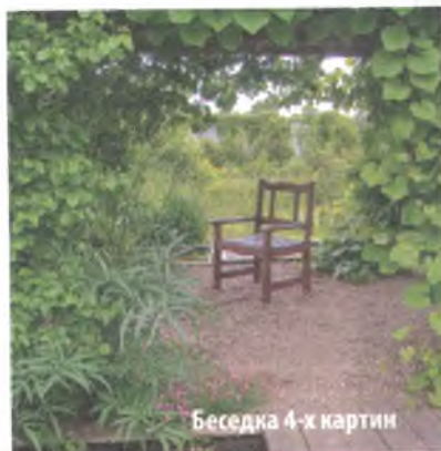
Беседка 4-х картин