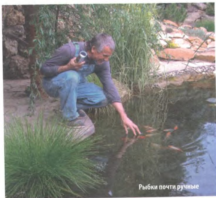
Рыбки почти ручные