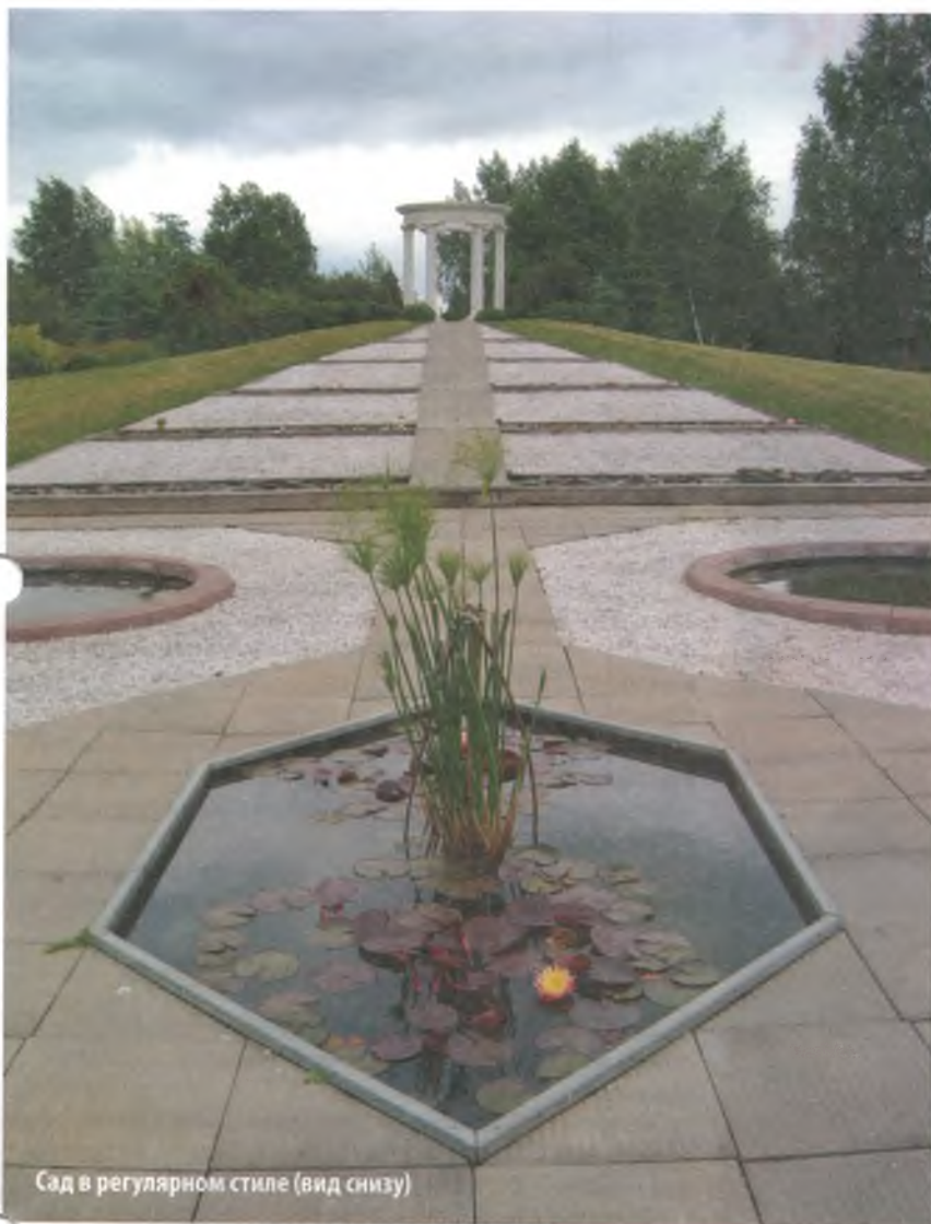
Сад в регулярном стиле (вид снизу)