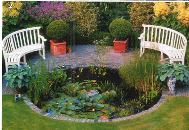
РИС: О. АБРАМОВА